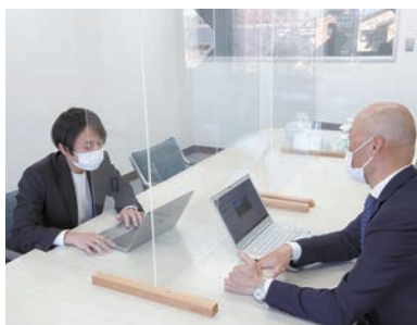
【専門家との相談の様子】