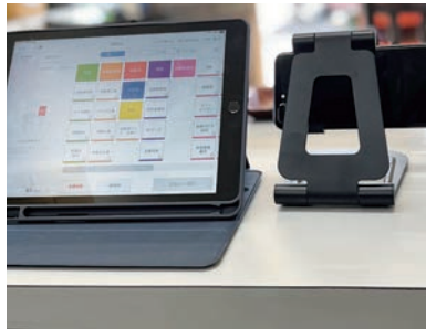
【インボイス制度に対応したタブレットPOSレジ】