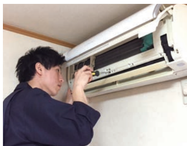
【作業の様子：一般エアコン清掃】