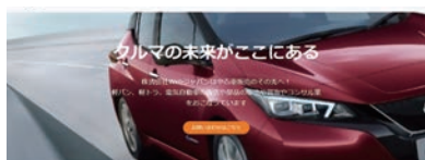
【Webジャパンコーポレートサイト】