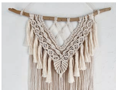
【作品例：マクラメ編みのタペストリー】