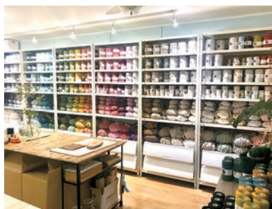
【店舗内：商品の陳列】