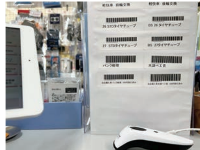
【バーコード活用による在庫管理の効率化】