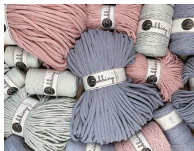
【主力商品：ポビニー社製の糸】