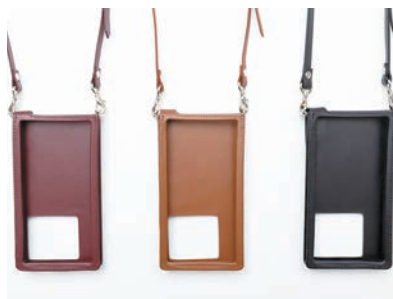
【首から下げる革製スマホケース】