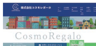
【販路開拓のための会社HP】