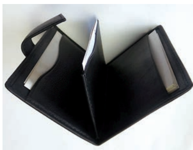
【新商品の名刺入れ】