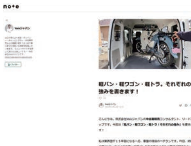
【オンラインコンサル投稿記事】