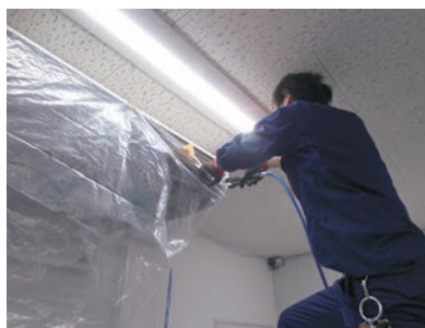
【作業の様子：業務用天吊型エアコン清掃】