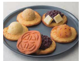
商品名：どらっふる

店内には毎朝焼きたてのどらやき「どらっふる」と「ポテりんご」「揚げたてのさつまいもチップス」などを製造する工房を設け、コーヒーやお茶、ソフトクリームを楽しめる席もご用意いたしました。従業員一同「笑顔とおもてなしの心」で皆様にご来店いただけますことを、心より楽しみにしております。