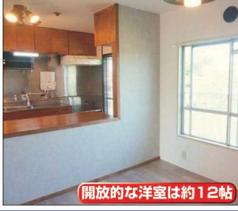
開放的な洋室は約12帖

No.2-002 売リマンション 331世帯のビッグコミュニティ 850 万円 ★南向きで日当たり良好 ★駅徒歩5分の立地 ★周辺環境良好