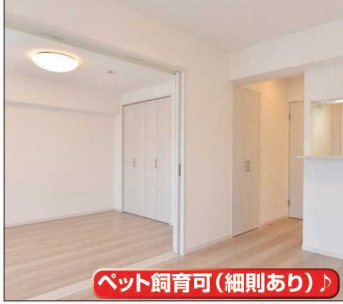
ペット飼育可(細則あり)

No.1-002 売リマンション ヴァンパル上尾II 新規リフォーム済 2,380 万円 ★南向きで日当たり良好 ★アフターサービス保証付き ★空家につきいつでも内覧可能