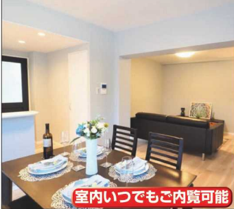
室内いつでもご内覧可能

No.5-001 売リマンション アステール上尾 2,199 万円 ★80㎡超!ゆとりあるファミリータイプ ★評判の良いデザインと安心のアフターサービス ★管理体制作良!大規模修繕も実施済み!!