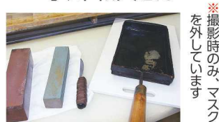
※撮影時のみ、マスクを外しています

■味蔵 小川 上尾市宮本町9-20 TEL.048-729-7345 京懐石を基本にした逸品割烹。 本物の味をお楽しみください! ★営業時間/17時～23時(L.O. 22時30分)★定休日/月曜日※年内は12月29日(水)まで、年明けは1月5日(水)から営業 ■上尾市三業組合 http://www.ageocci.or.jp/sangyoukumiai/index.html ★「あげおグルメ応援お食事券」スタンプカード・プレゼントキャンペーンを実施中です。詳細は、上記QRコードへ!