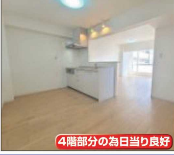
4階部分の為日当たり良好

No.2-001 売リマンション 上尾サンハイツ 新規内装リフォーム物件 1,499 万円 ★南向きで日当たり良好 ★駅徒歩5分の立地 ★空室につきいつでも内覧可能