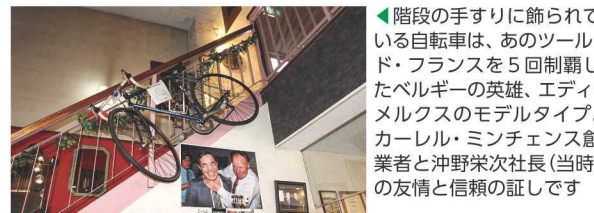
◀階段の手すりに飾られている自転車は、あのツール・ド・フランスを5回制覇したベルギーの英雄、エディ・メルクスのモデルタイプ。カーレル・ミンチェンス創業者と沖野栄次社長(当時)の友情と信頼の証しです