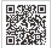
▲ 掲載申込フォーム