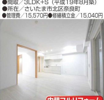
内装フルリフォーム

宮原9分フルリフォーム 2,690万円 ★アドグランデ大宮宮原 ★3方向角部屋★ベットの飼育可能 ★ワイドバルコニー