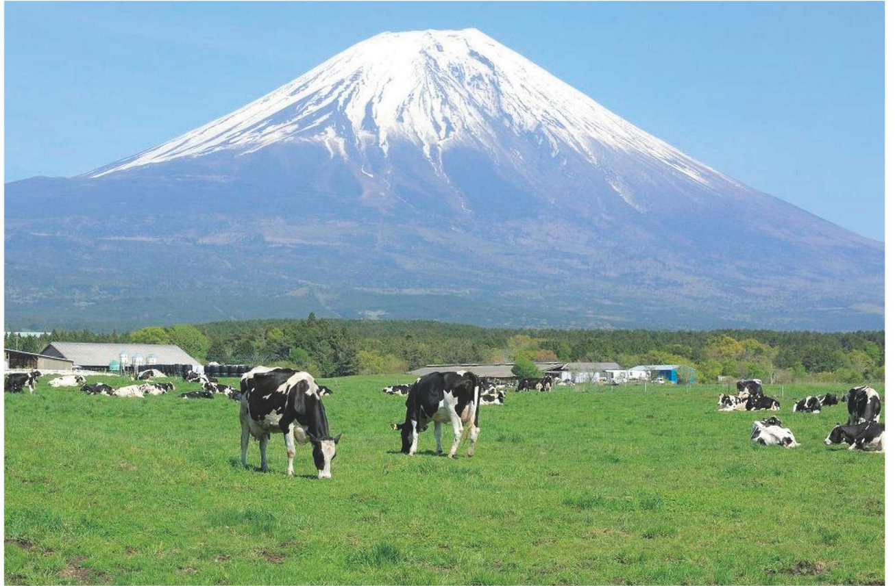
▲2021年の干支は「辛丑(かのと・うし)」。相場格言では「丑でつまずき」といわれますが、相場用語の「ブル(雄牛)」は上昇を意味するとか。前回の丑年(2009年)はリーマンショックから回復した1年でした。富士の裾野で悠々と草を食む牛たちのように、穏やかに希望に満ちた年になりますように！(撮影地/静岡県富士宮市・朝霧高原)