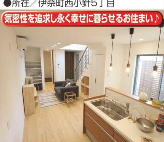
気密性を追求し永く幸せに暮らせるお住まい

高気密・高断熱 2,500万円(税込) ★断熱はアクアフォームを使用 ★気密測定を実施 C値:0.3cm/m 2 ★LDKに吹抜のある住まい