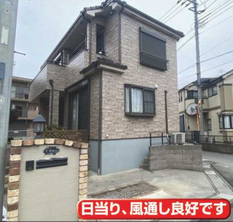
日当たり、風通し良好です

上尾市二ツ宮 東南側道路に面した角地 2,460万円 ★閑静な住宅街★東南側道路に面した角地 ★現況空家いつでも内覧可