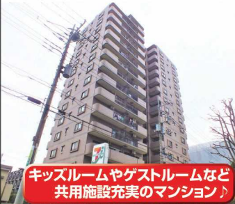
キッズルームやゲストルームなど共用施設充実のマンション

コスモ上尾ステーションビュー 2,500万円 ★通勤や通学に助かる駅徒歩4分 ★15階建の9階のお部屋 ★空室のためいつでもご見学OK★中央小学校・上尾中学校