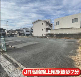
JR高崎線上尾駅徒歩7分

上尾駅徒歩7分 東南側道路に面した売地 2,680万円 ★建築条件なし★日当たり良好 ★住環境良好