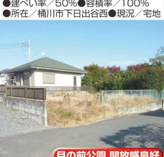
目の前公園 開放感良好

下日出谷西 東南角地 1,980万円 ★建築条件なし ★高台の東南角地 ★区画整理地内 前面道路6m