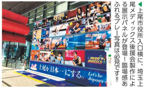
上尾市役所入口横に、埼玉上尾メディックス後援会製作による展示パネルが登場! 臨場感あふれるプレー写真は必見です!!

※このコーナーに掲載中の『言葉の力』は著作権の関係でWebでは掲載できません。ご了承ください。