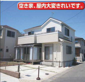
空き家、屋内大変きれいです。

テラス付き、日当たりのいい中古戸建 3,380万円 ★そのまま住める築浅物件 ★並列で二台駐車可能