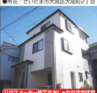
ハウスメーカー施工のおしゃれな注文住宅

大成町 おしゃれな戸建 3,380万円 ★ニューシャトル・東武野田線も徒歩圏内 ★大成小学区★閑静な街並みの大成町