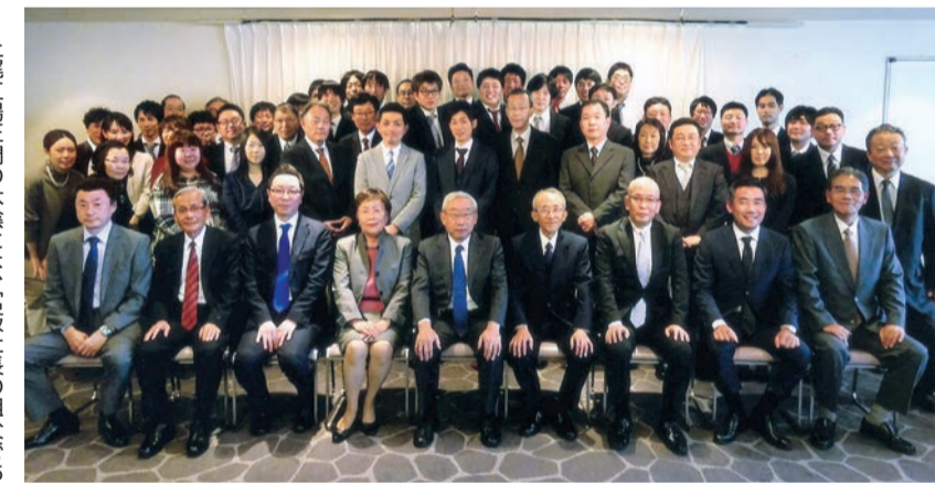
▶昨年10月、大宮・東天紅で開催された100周年記念パーティーにて、いざ、新たな時代へ！