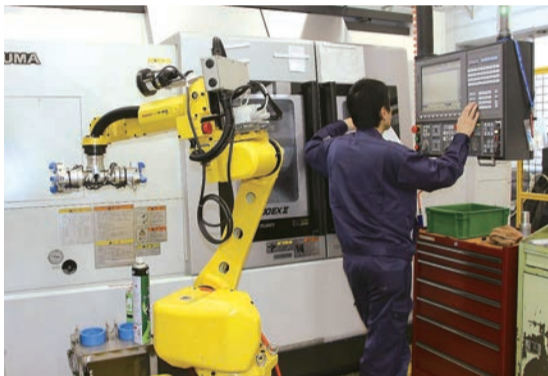
▼アーム型の産業ロボットを装備した最新の複合加工機