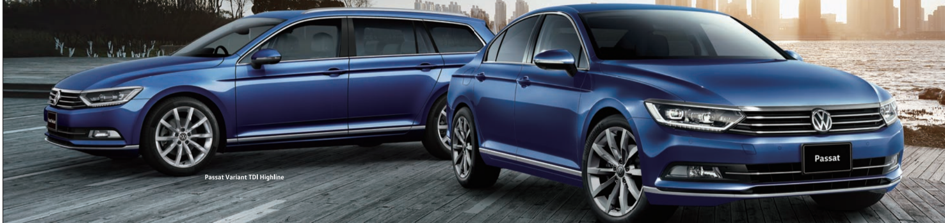
Passat Variant TDI Highline