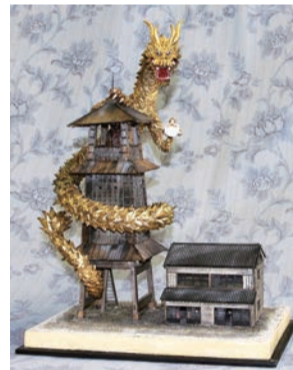
▲「川越・時の鐘」(小江戸の守護神・神龍)。1/25スケールで超リアルに再現！2017年9月製作