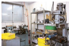
▲最新設備の工場でも年代物の加工機械が今も現役で活躍中!