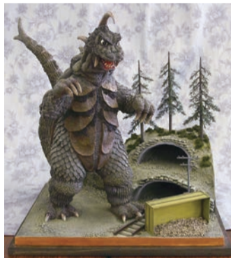
▲「ゴメス50cm完成品」(ジオラマベース付) 2017年2月製作