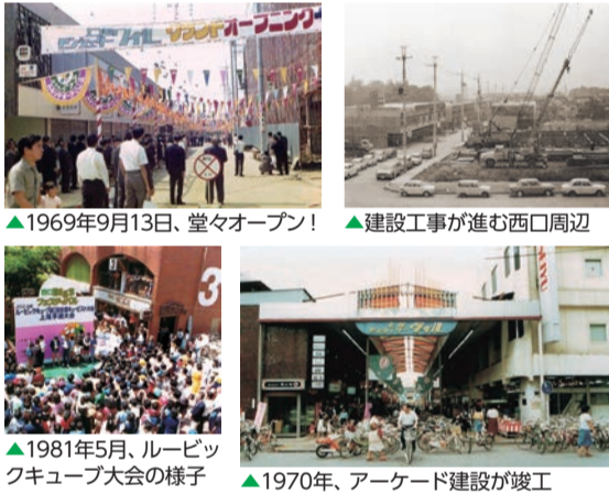
▲1969年9月13日、堂々オープン! ▲建設工事が進む西口周辺 ▲1981年5月、ルービックフェスティバルの様子 ▲1970年、アーケード建設が竣工

■協同組合 上尾モンシェリー 事務局/上尾市谷津2-1-50-9 TEL.048-773-1871