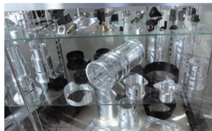
▲玄関ホールに陳列されている製品サンプル