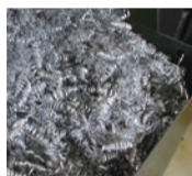
▲NC旋盤の回転台 & カッター部分と、削り出された切粉