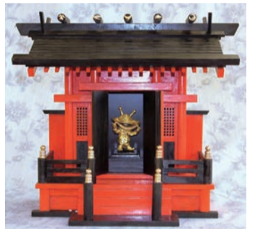
▲「金箔カネゴン」(神棚セット)。2017年12月製作。建物に潜む“隠し猫”を探し出すのも“岡ファン”の醍醐味！