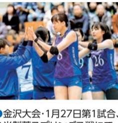
●金沢大会・1月27日第1試合、久光製薬スプリングス戦にて

※このコーナーに掲載中の『言葉の力』は著作権の関係でWebでは掲載できません。ご了承ください。