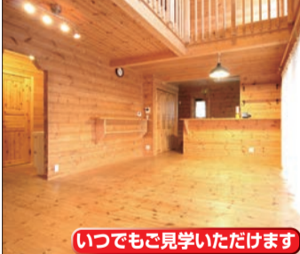
いつでもご覧いただけます