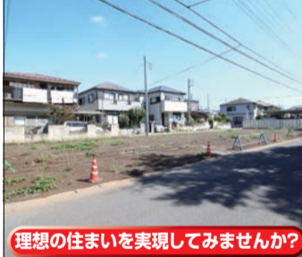
理想の住まいを実現してみませんか?