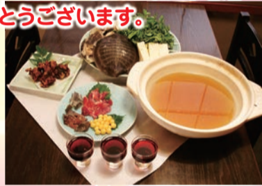
写真は3~4人前 生血(ワイン)・刺身・唐揚・鍋・雑炊

あけましておめでとうございます。 その日仕入れた新鮮なすっぽんを使用。コラーゲン・ビタミン・鉄分が豊富で栄養満点。鍋の後の雑炊は格別です。