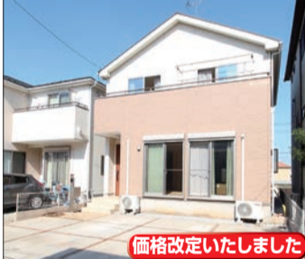
価格改定いたしました