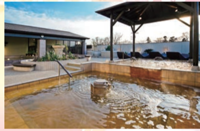
営業時間 / 10:00-25:00(最終受付24時) 刺青・タトゥーの方の入浴不可/オムツの方の入浴不可

開放的な露天風呂が人気のアジアンスパ銭湯。源泉かけ流しの温泉や高濃度炭酸泉など12種類のお風呂と、3室7種類の岩盤房は、時間無制限なので1日ゆっくり寛げます。年末年始も休まず営業致します。