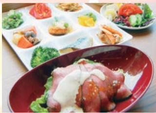
*ワンディッシュ「ローストビーフ」付き

むさしのグランドホテル&スパ内にある、カフェ&レストラン The Lobbyでは、自社農園の新鮮野菜サラダや焼立てパンを含む「和洋中」ビュッフェレストランです。フリードリンク&ソフトクリーム付きのランチビュッフェは、満足感たっぷりの食事が出来ます。