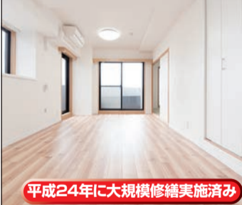
平成24年に大規模修繕実施済み