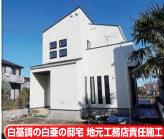
白基調の白亜の邸宅 地元工務店責任施工