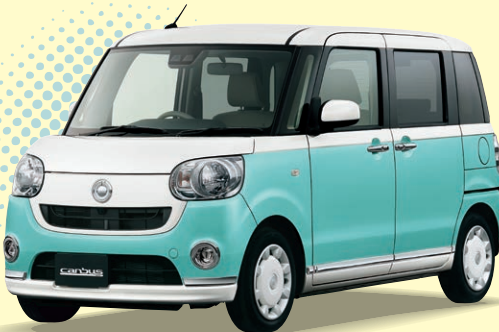
Photo: X “リミテッドメイクアップ SA III” 2WD. ボディカラーのパールホワイト車体ファインミメタリックは 64,800円高のメーカーオプションで、価格には含まれておりません。

ムーブ キャンバス X “リミテッドメイクアップ SA III” [660cc/2WD/CVT] 車両本体価格の一例* 1,479,600円 (消費税込み)