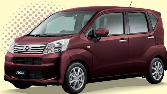
Photo: X “SA III” 2WD. ボディカラーのプラムブラウンクリスタルマイカは 21,600円高のメーカーオプションで、価格には含まれておりません。

ムーブ X “SA III” [660cc/2WD/CVT] 車両本体価格の一例* 1,274,400円 (消費税込み)