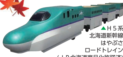
▲H5系北海道新幹線はやぶさ ロードトレイン (JR北海道商品化許諾済)