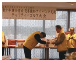
【アイバンク支援金として目録贈呈】

10月13日(金)、リバーサイドフェニックスゴルフクラブにおいて、「青少年健全育成・災害援助・アイバンク支援チャリティーゴルフ大会」を開催。小雨降るこの秋一番の寒さでしたが、170名のご参加をいただき、盛大に実施することができましたことを御礼申し上げます。