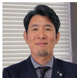
埼玉県商工会議所青年部連合会 次年度(平成30年度)会長 上尾商工会議所青年部 顧問 株式会社 富吉 代表取締役