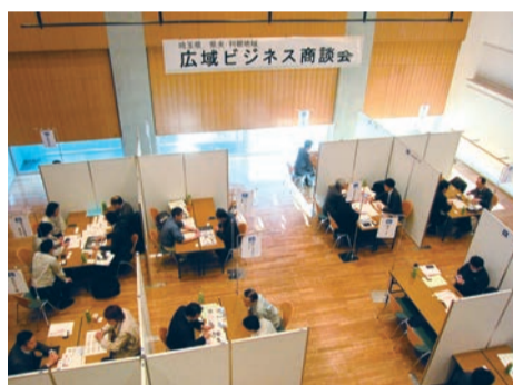
▲11月29日、桶川市民ホールにて、11商工団体連携による「広域ビジネス商談会」を開催。会員企業の販路開拓を支援しました