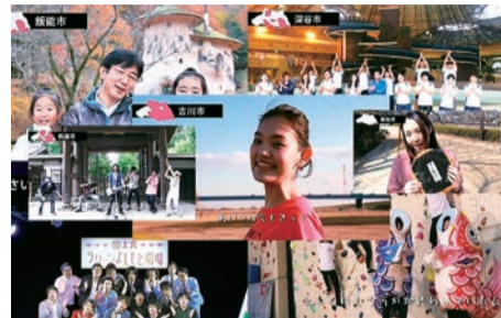
▲県内全40市からの投稿動画でつないだ「そうだ埼玉」第2弾(明日は笑顔さ)がついに完成。「そうだ埼玉」「明日は笑顔さ」を収録した、天下茶夜所属ロックバンド「6才児」のセカンド・アルバムはiTunesほかで好評配信中です!

埼玉県おもしろ内閣の内閣総理大臣として、県内を駆け巡る鷲谷さん。すべてはみんなの笑顔のために!