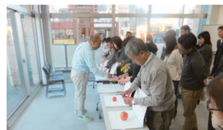
▲11月9日、上尾市プラザ22にて、商品撮影のノウハウを学ぶ商業部会「写真撮影実践講座」を開催