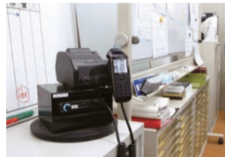
▲GPS機能付き無線機を活用して、業務報告もスムーズに。スタッフ同士のコミュニケーションにも効果抜群! 現在位置が一目で確認できるので、配送効率も格段にアップしました