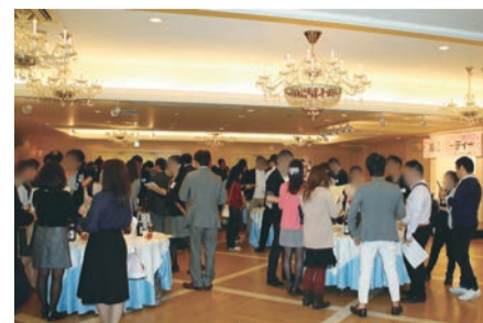
▲10月16日、東武バンケットホール上尾にて、上尾商工会議所主催「婚活パーティー」を開催。男女各40名の参加申込を受け、13組のカップルが成立