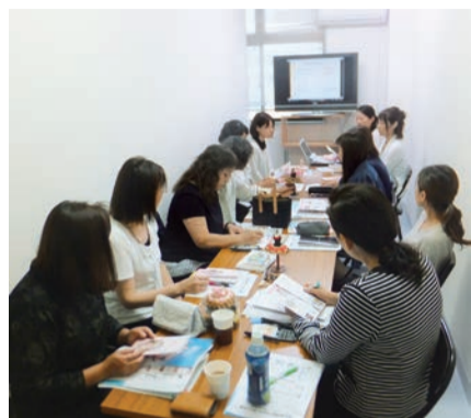
▲6月22日~7月20日、上尾市創業支援事業計画に基づく特定創業支援事業の一環として、「女子のための「しごとづくり」セミナー」全5回を開催