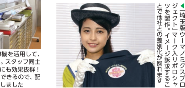
◀埼玉版ウーマノミクスプロジェクトを製作、イメージ訴求することで他社との差別化が図れます

小さな会社ですから、私にとって社員・スタッフは家族同様の存在。だからこそ、女性も、若者も、年配