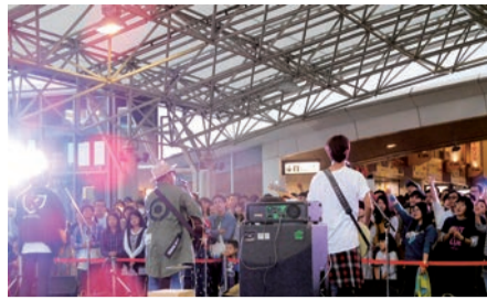
▲10月1日、「AGEOまちフェス2016」開催！ 同時開催された「AGEパル4」や駅自由通路「出張商店街」と合わせて、上尾駅前が大勢の人で賑わいました

上尾商工会議所は、地域総合経済団体として、商工業の総合的な改善発展と社会一般の福祉向上に資することを目的に、多岐にわたる事業活動を展開しています。活動実績の一例を写真で紹介いたします。