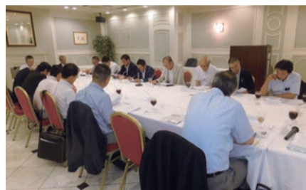
▲8月3日、会員支援委員会との合同による「支部長会議」を開催。会員拡大強化月間への協力を依頼