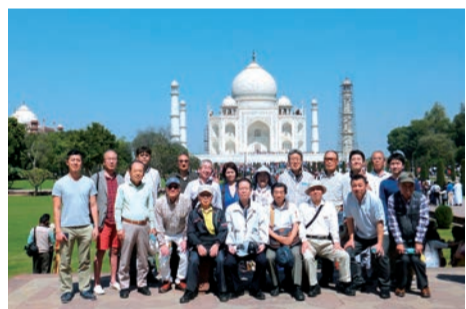
▲3月3~7日、上尾商工会議所・上尾ものづくり協同組合主催による「第28回海外経済事情視察研修会」を実施。総勢28名が3泊5日の行程でインドの首都・デリー等を訪問