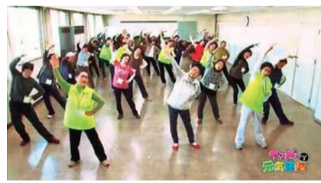
▲産・学・官・民が連携して制作された「アップー元気体操パート2」は今年3月に完成。5月に開催された「第33回いきいきライブ大運動会」でお披露目され、会場からアンコールが起こるほど大反響でした

▶ここで「埼玉ポーズ」を再確認! まず、両手の人差し指と親指で輪っか(埼玉の玉)を作り、胸の前でクロスします(県鳥・シラコバトのイメージ)。左足を少し前に出すのが完成形です