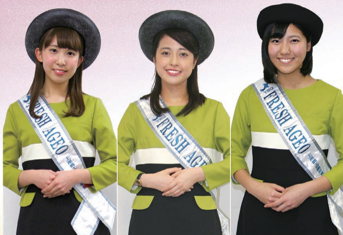
▲「2017フレッシュあげお」の春夏用・新ユニフォーム。秋冬用にはボレロ(上着)を着用します(試着のためイメージは若干異なります)