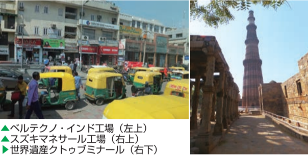
▲ベルテクノ・インド工場（左上） ▲スズキマネサール工場（右上） ▲世界遺産クトゥブミナール（右下）