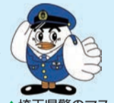
▲埼玉県のマスコット「コバトン」