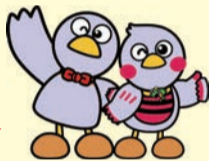
▲埼玉県のマスコット「コバトン」「さいたまっちゃん」

http://www.pref.saitama.lg.jp/a0608/smile-net/index.html