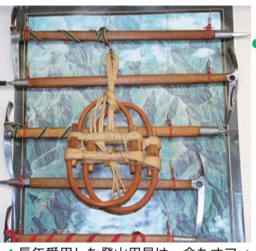
▲長年愛用した登山用具は、今もオフィスの壁に飾られています。一番上が想い出のピッケル「エバニューアタック」

同時期に購入したアイゼンも健在です ▲総合建築物クリーニング 誠意と技術で施工する 有限会社 ウチダ塗装 上尾市上472-2 TEL.048-774-1744 FAX.048-774-1555 http://uchida-biso.com