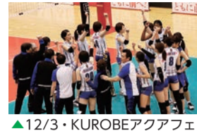
▲12/3・KUROBEアクアフェアリーズ戦