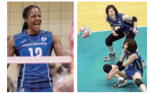
▲12/4・仙台ベルフィーユ戦