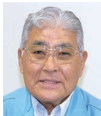
スカイ・エンジニアリング(株) 代表取締役会長 上尾電気工事協同組合 代表理事