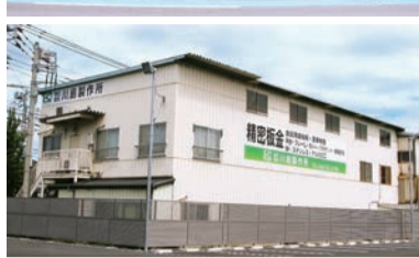
▲「県道51号・川越上尾線(ニッサン通り)に面して建つ川島製作所。昨年末、外壁塗装してイメージ一新! 真新しい看板が目玉を引きます(写真下は裏側からの外観)」