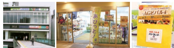
▲「あびっと！」入口の通路側に「AGEバル4」パンフ・ラックを設置。上尾特産品なども販売していますので、お気軽にお立ち寄りください！