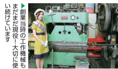
▲創業当時の工作機械もまだまだ現役! 大切に使い続けています