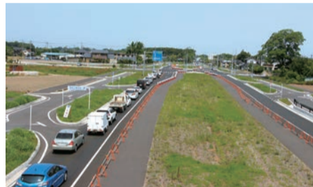
▲「領家かっぱ橋」歩道橋から領家交差点を望む