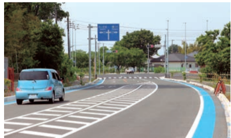
▲上尾道路・領家交差点へのアクセス道路は、領家工業団地の「新たなゲート」として機能している