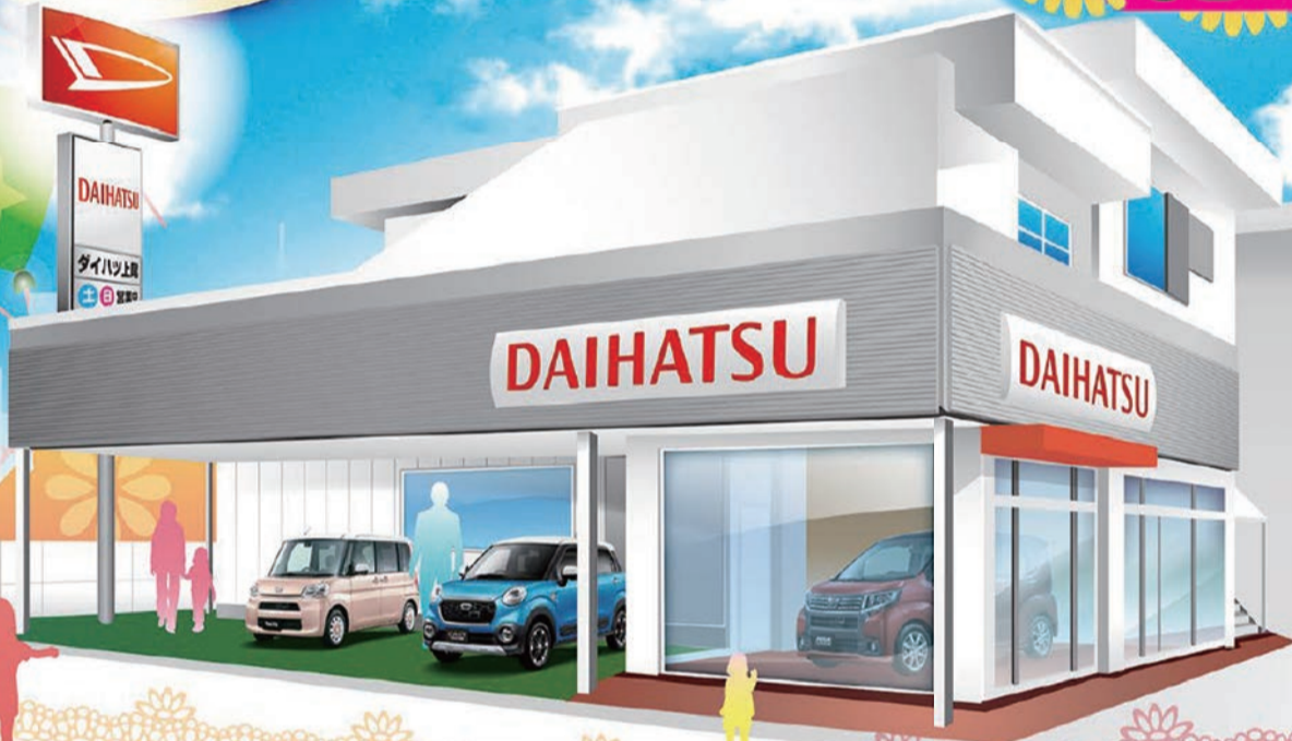
※写真・イラストはイメージです。