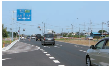
▲小敷谷(西)交差点手前、圏央道への案内標識

4月29日16時、大型連休の初日となる「昭和の日」に、上尾道路 I 期区間(県道上尾環状線・上尾市小敷谷～県道川越栗橋線・桶川市川田谷/4.7km)が開通しました。国道16号に接続する宮前 I C と圏央道・桶川北本 I C がつながることにより、圏央道へのアクセス向上と、国道17号の交通混雑の緩和が期待されます。