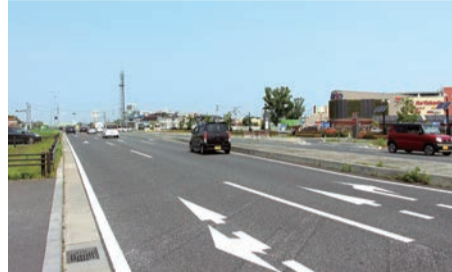
▲寺丁目北交差点から起点の小敷谷東交差点を望む