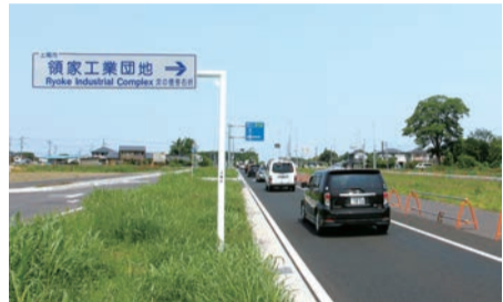
▲領家工業団地への案内標識も掲げられた

残りの未開通区間(上尾道路 II 期/桶川北本 I C・桶川市川田谷～鴻巣市箕田)9.1kmについても、昨年からの用地買収が始まっており、全区間開通が待たれます。