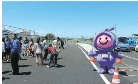
▲開通日の午前中、現場見学会として歩行者に開放