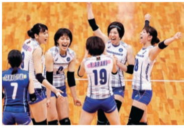
第65回黒鷲旗全日本男女選抜大会の初戦、JTマーヴェラスを3-0で下し、チャレンジマッチの雪辱を果たしました