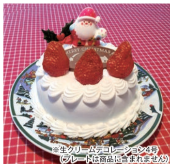
★生クリームデコレーション4号 (プレートは商品に含まれません)