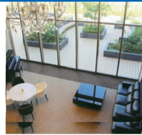
▲エントランスから続く吹き抜けのロビーは広々として開放的。高級リゾートホテルを思わせる、心が和むつろぎの空間です

★見学・相談を随時受付中です! ★問合せ先/ (株)レーベンコーポレーション 営業企画室<048-776-5556>へ!