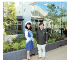
▲ウッドデッキの中庭は四季折々の風情が楽しめる憩いの場