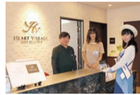
▲エントランス脇にある受付カウンター。入居者・利用者のみなさんにきめ細かく対応します