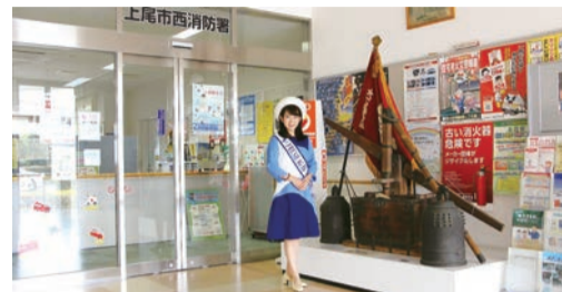
▲上尾市西消防署の事務所に「防災体験コーナー」の受付があります。展示物は木製半脚筒(はんそくとう=消火ポンプ、別名:龍吐水<りゅうどすい>)と半鐘です