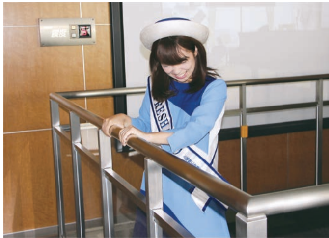
▲震度計の数値が上昇して震度6超の大揺れに!