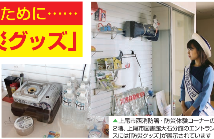
▲上尾市西消防署・防災体験コーナーの2階、上尾市図書館大石分館のエントランスには「防災グッズ」が展示されています

地震や洪水などの災害に備えて、日頃から家庭・職場・地域における防災対策を充実・強化しておきたいもの。備えあれば憂いなし! 災害に備えた防災点検を実施しましょう。非常用持ち出し品を入れ替えの際は、非常食を試食しながら家族だんらん、みんなで防災について話し合しましょう。