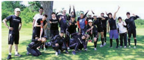
▲これからトレーニングスタート! やるぞ~!!