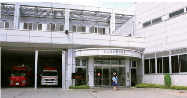
上尾市西消防署・複合施設入口にて