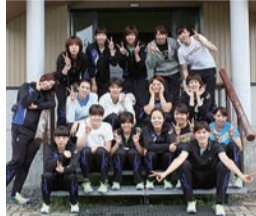
▲合宿終了! 初日と比べてやつれて見えるのは気のせい???