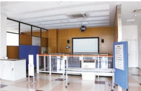
▲地震体験コーナーでは、震度1から7までの揺れを実体験。また、関東大震災(1923年9月1日、最大震度6)、十勝沖地震(1952年3月4日、最大震度6)、宮城県沖地震(1978年6月12日、最大震度5)、日本海中部地震(1983年5月26日、最大震度5)、兵庫南部地震(阪神・淡路大震災、1995年1月17日、最大震度7)、新潟県中越地震(2004年10月23日、最大震度6強)といった過去の地震や、今後予想される東海・東南海地震の想定震度も体験できます