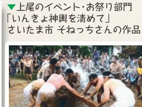
▼上尾のイベント・お祭り部門 「いんぎょ神輿を清めて」 さいたま市 そねっちゃんさんの作品