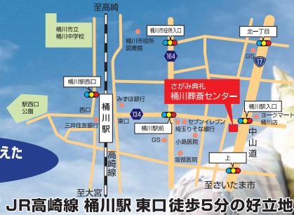
JR高崎線 桶川駅 東口徒歩5分の好立地