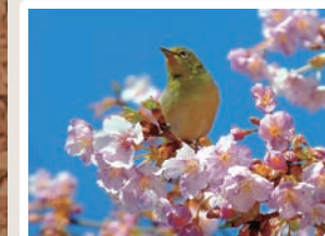
▲上尾の四季・風景部門 「河津桜とメシロ」 上尾市 気ままな旅人さんの作品

2月9日(月)に行われた審査会にて応募総数199作品の中から各部門の会長賞、佳作が決定しました(以下、会長賞)。自然学習館1階にて展示開催しています。