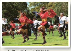
▲上尾の元気・笑顔部門 「楽しく踊ろう」 上尾市 ドラ声くんさんの作品