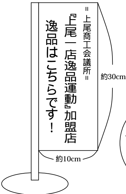
ミニのぼり旗(作成例)