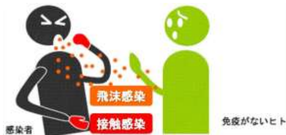
図1 新型インフルエンザの感染経路