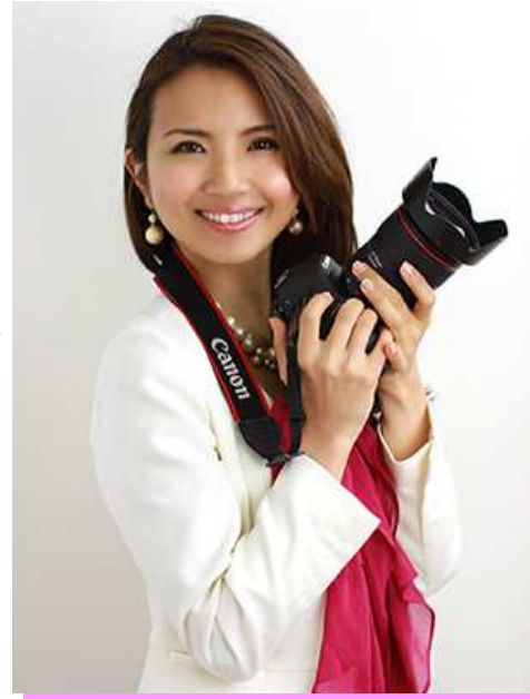
一般社団法人フォトコミュニケーション®協会 代表理事 フォトグラファー