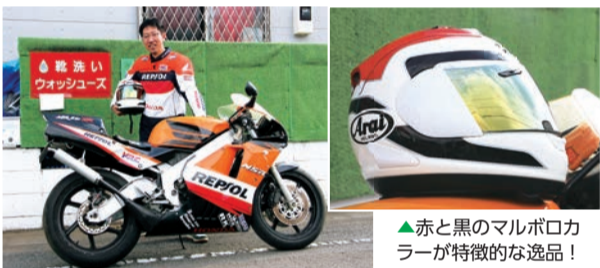
▲赤と黒のマルボロカラーが特徴的な逸品!

■靴専門クリーニング店・総合リサイクル業 ウォッシュズ 上尾市平塚1-118 TEL.048-871-9619(FAX共通) http://washoes.jp ★営業時間/9時～18時 ★休日/日曜・祝日 2001年に開業した、上尾で最初の靴専門クリーニング店。匠の技をもつクリーニング師がていねいに1足ずつ、手仕上げ洗いで洗浄。あなたの大切な靴がよみがえります。WEBまたはFAXでお気軽に見積り・問合せを!