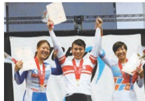
▲9月開催「第87回全日本選手権競輪大会」女子エリートケイリンでは1位に!“ケイリン日本チャンピオン”のタイトルを初獲得!!