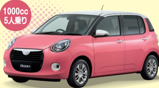
Photo: X "SA III" 2WD. ボディカラーのホワイト×ジュシーピンクメタリックは 54,000円高のメーカーオプションで、価格には含まれておりません.

ブーン STYLE "SA III" [1000cc/2WD/CVT] 車両本体価格の一例* 1,522,800円 (消費税込み)