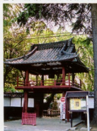
▲鎌倉時代から続く稲嶺寺の稲門

往時の隆盛をとどめるように、歴史を感じさせる神社仏閣があちこちに点在しています。その中の1つ、原市駅から徒歩4分のところにある快楽山安養院「稻嶺寺」(上尾市五箇町14-2)は、1382年(永徳2年)、