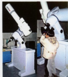
▲「上尾市立自然学習館」にも納入された「15cmクーデシステム望遠鏡」。音声制御方式が子どもたちに人気です。

高所 近年では、1999年7月にオープンした「群馬県立くま天文台」（群馬県吾妻郡高山村）に一般開放施設としては世界最大の直径11メートルの天体ドーム（コビュータ制御式）を含む3基を施工しました。これは群馬県100周年の記念事業の一環として着工されたものでです。県内ではさいたま新産業拠点「SKIPシティ」にある「川口市立科学館」サイエンスワールドのインターネッ