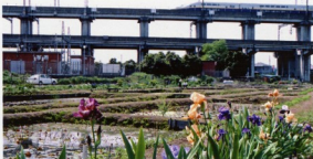
▲原市沼の池に咲き誇る夏の花畑。この池は上野・沼南駅の池田上野駅南側、下野ニューシャトルの使老池(おきせの池)。